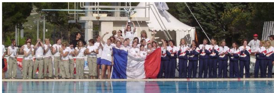
Equipe de France Féminine : championne d'Europe 2005